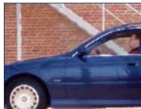
Progressif, toutes les lignes sont affichées en même temps

Le balayage progressif est utilisé à la place du balayage entrelacé dans caméras CCTV analogiques (PAL/NTSC). Grâce au balayage progressif, tous les pixels (lignes) sont capturés au même moment, ce qui permet d'afficher des images en mouvement sans déformation.