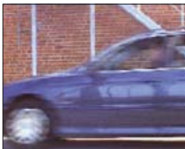
Entrelacé, un décalage entre lignes paires et impaires altère la qualité des images